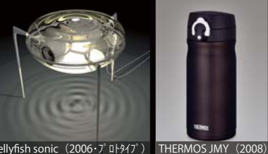
jellyfish sonic (2006・アトリエ)

独特なステアリングシステム越しに見えるメータや、球状のフード、左右のフェンダーなど、搭乗者を走りに誘う眺めをつくる。