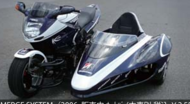
EMERGE SYSTEM (2006・販売中オートバイ車別 税込 ¥2,551,500 ~)