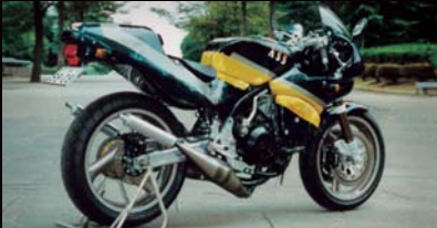
自社製フレーム二輪車 (1995・販売終了)